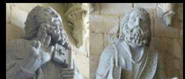
ST PIERRE ET ST ANDRÉ CATHÉDRALE Saint-Pol de Léon