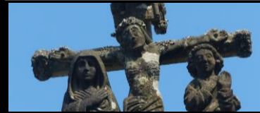
STATUE DE LA VIERGE CALVAIRE DE LA TRINITÉ Lanzignac, Landeleau