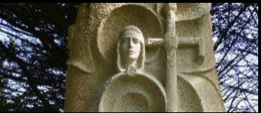
STÈLE AUX PÉRIS EN MER TRÉBOUL Douarnenez