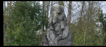
MONUMENT AUX MORTS ET TOMBE ANSQUER Cimetière de Lababan