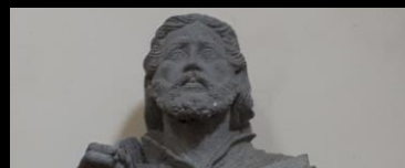
SAINT MATHIEU Église Saint-Mathieu Quimper