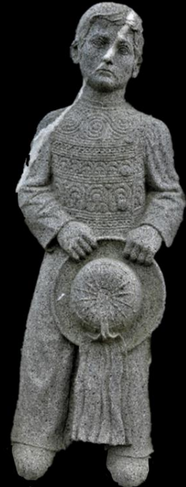
Détail monument aux morts Peumerit