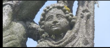
CROIX DE RUGUELVEN RUGUELVEN Lababan