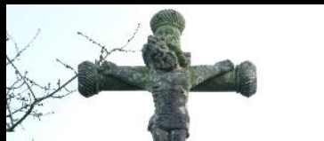
CROAS AR CHAPEL KERINCUFF Saint-Thégonnec

XVIe : Saint Herbot, Pleyben, Guimiliau, XVIIe : Locronan, Saint-Thégonnec, Plougastel-Daoulas ( ..ex-voto pour la cessation de l'épidémie de peste de 1598 ! )