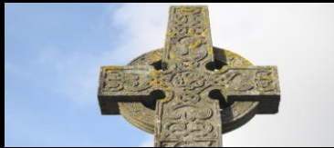
CROIX CELTIQUE CARREFOUR PORTE VEZINS Centre ville de Plouhinec