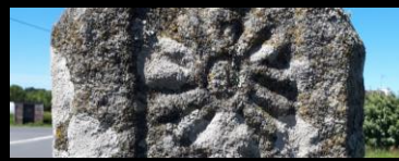
CROIX CARREFOUR KERFRAVAL Cleden-Cap Sizun