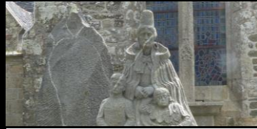
MONUMENT AUX MORTS ÉGLISE Peumerit