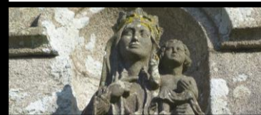
VIERGE CHRIST ST-JEAN CHAPELLE DU DRENNEC Clohars-Fouesnant