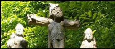
CALVAIRE CHAPELLE SAINT LAURENT Saint-Thois