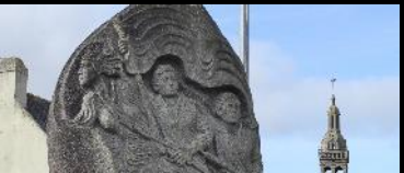
STÈLE À LA RÉSISTANCE SAINTE MARIE DU MENEZ HOM Plomodiern