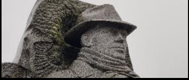
MONUMENT À JEAN MOULIN CENTRE VILLE Châteaulin