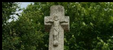
CHRIST PENN AR PARC PENFARS Saint-Thégonnec