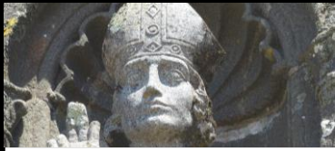
ST CORENTIN et ST GUENOLE EGLISE ND BONNE NOUVELLE Hôpital Camfrout