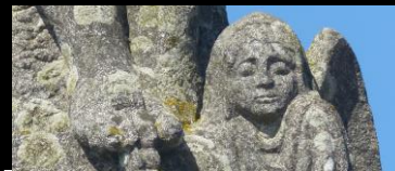
CROAS OLET KERGRENN OUEST Saint-Thégonnec